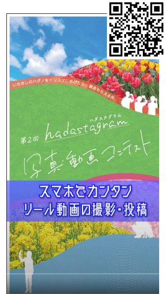
▲【初心者向け】よく分かるリアル動画の作り方

答5:秦野市のチャンネルの中では、視聴回数が約2万回の「初心者向けのよく分かるリアル動画の作り方」や「中学生英語スピーチコンテスト」が多く視聴されています。この結果から、いわゆるハウツー系が一定の需要があると分析しています。こういったものを企画立案することが今後の発信の意味になっていくのではないかと考えています。